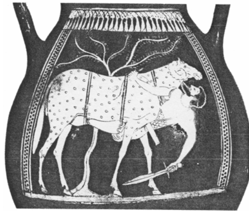
Odysseus verlässt unter einen Widder gebunden die Höhle des Polyphem

Mit diesen Worten führt Homer in seiner Odyssee seinen Helden Odysseus ein: