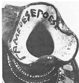
Oinochoe (Weinkrug) des Töpfers Gamedes, 6. Jh. v. Chr.

Inschrift: Gamedes epoese: Gamedes hat (es) geschaffen